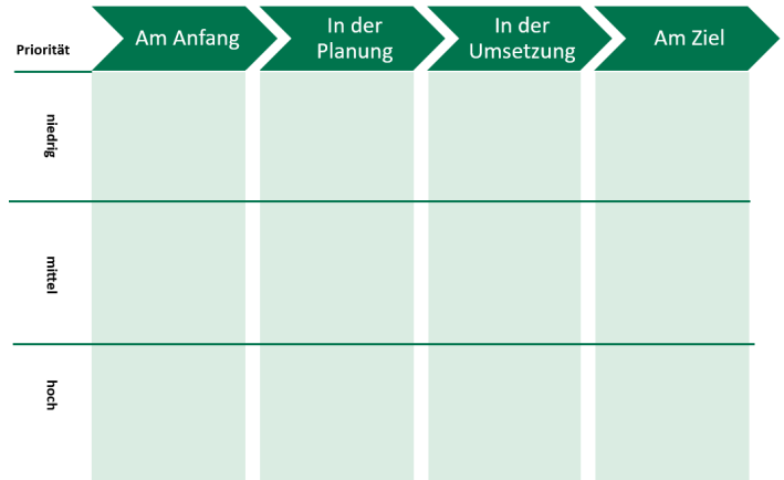
Abb.2: Planungsmatrix im mit Priorisierung

Im Bereich pädagogische Rahmenbedingungen könnte dies exemplarisch wie folgt aussehen: